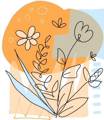
(A) Plot1 with a single image