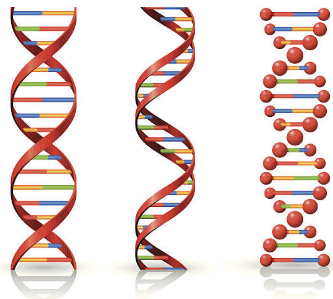
(b) Molécula de DNA