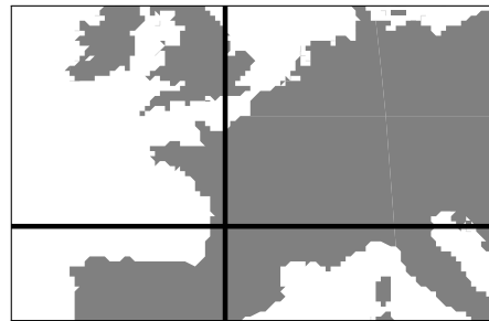
FIGURE 3 – Zoom sur la Fig 2.