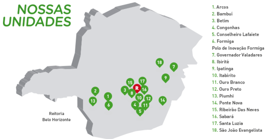
Figura 4 – Mapa de unidades do IFMG.