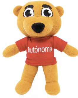
Figura 2.3: Pumín Peluche. Figure opción [ht] para forzar luego del párrafo anterior y en la parte superior de la página

tetuer eu, nonummy id, sapien. Nullam at lectus. In sagittis ultrices mauris. Curabitur malesuada erat sit amet massa. Fusce blandit. Aliquam erat volutpat. Aliquam euismod. Aenean vel lectus. Nunc imperdiet justo nec dolor.