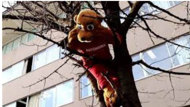
Figura 2.1: Pumín Trabajando en Temuco. Figure option [b] para ponerlo en la parte inferior de la página.