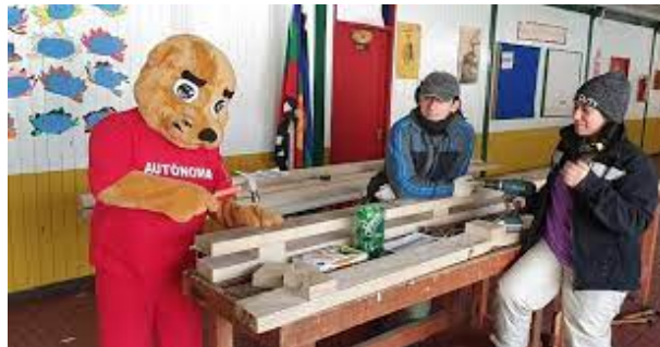
Figura 2.2: Pumín Trabajando en Temuco. Figure opción [h] para ponerlo en el lugar.

Para insertar una imagen en el lugar, con la opción [h]. Ver Figura 2.2