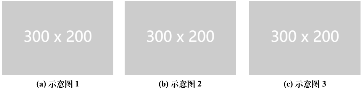
图 2 一行三张子图并排示意